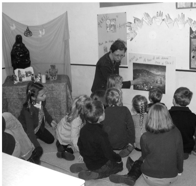
Les "Bouts d'choux" (éveil à la Foi) sous le regard de Notre Dame de Liesse. (samedi 17 décembre 2011)